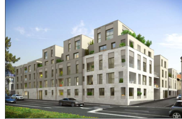
B rue d'Oseille

U12 - RESIDENCE HERMES PLAN COM indice A - novembre 2021